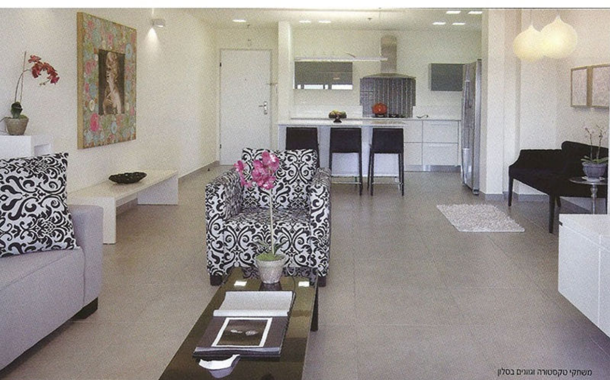
משחקי טקסטורה וגוונים בסלון

בסלון שולבה מערכת ישיבה המורכבת ממשחקי טקסטורה וצבעוניות בשחור-לבן-אפור ודיגום חלק ומעוטר. מערכת ישיבה זו משתלבת עם אלמנטים בנייים מגבס, לתוכם הושקעה טלוויזיה דקת מסך, תחתיה נבנתה יחידה מזנון נמוכה בצבע לבן. בנוסף לפינת הישיבה המרכזית, נוצרו פינות קטנות ומשלימות, הנותנות במה לפריטים ייחודיים – מסגרת מעוטרת לתמונת מרלין מונרו המתכתבת עם שנות ה-60, ספה "בארזקית" שחורה עם גב מרופד בשיטת ה"קאפיטונאג", שולחנות צידיים קטנים, גופי תאורה כדוריים בסגנון שנות ה-70 ועוד. כל אלו יוצרים כעין "במות תצוגה" המשובבות את העין, מבלי להעיק על ההרמוניה הכללית. אל החלל הפתוח משתלב גם המטבח בלבן צח, בעל מראה הייטקי, המועצם על ידי מקרר וקולט אדים בגימור כסוף, דלפק לבן וכסאות שחורים, המשלימים את המראה הנקי והמינימליסטי.