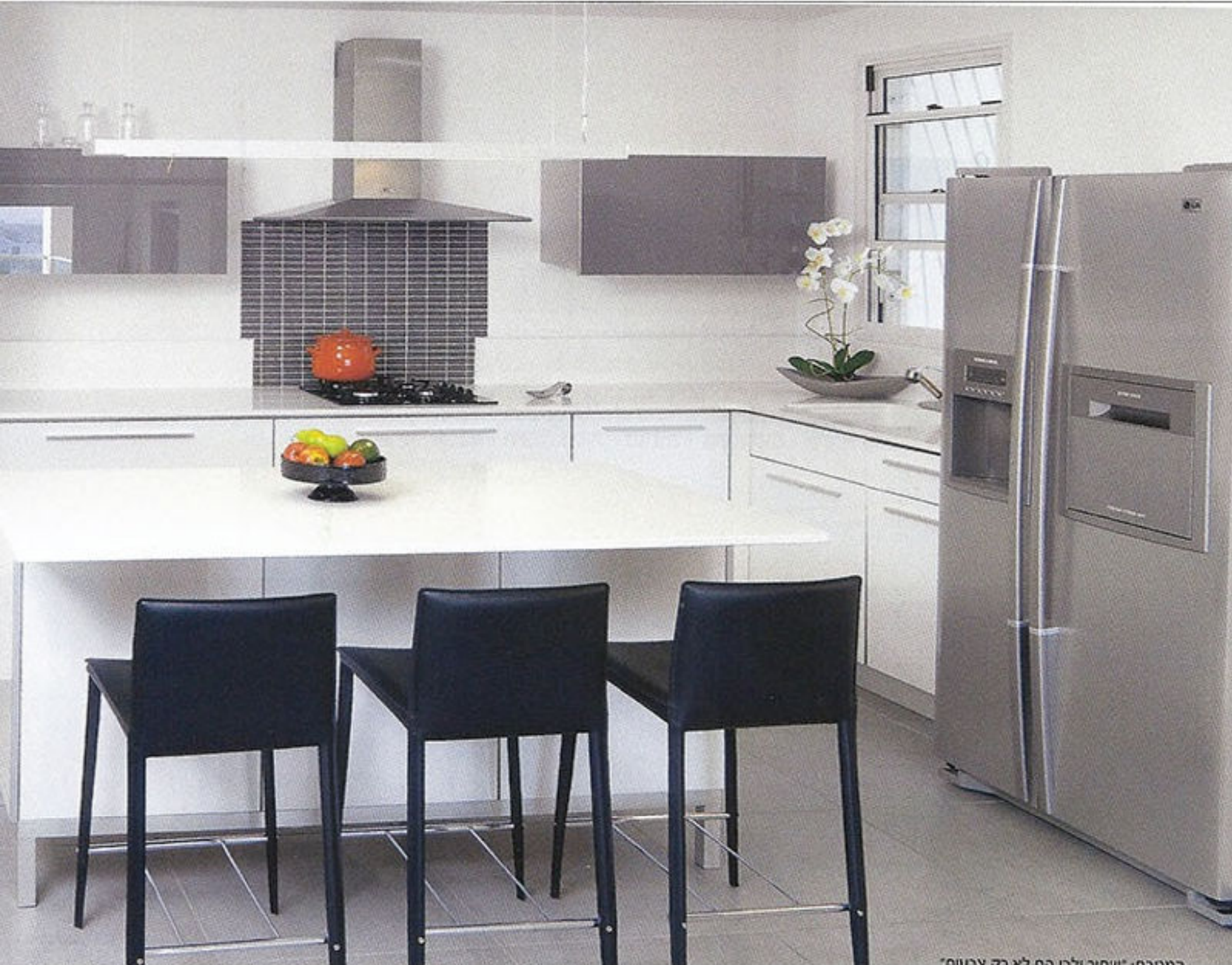
המטבח: אינטרנל, לא רק ציוד