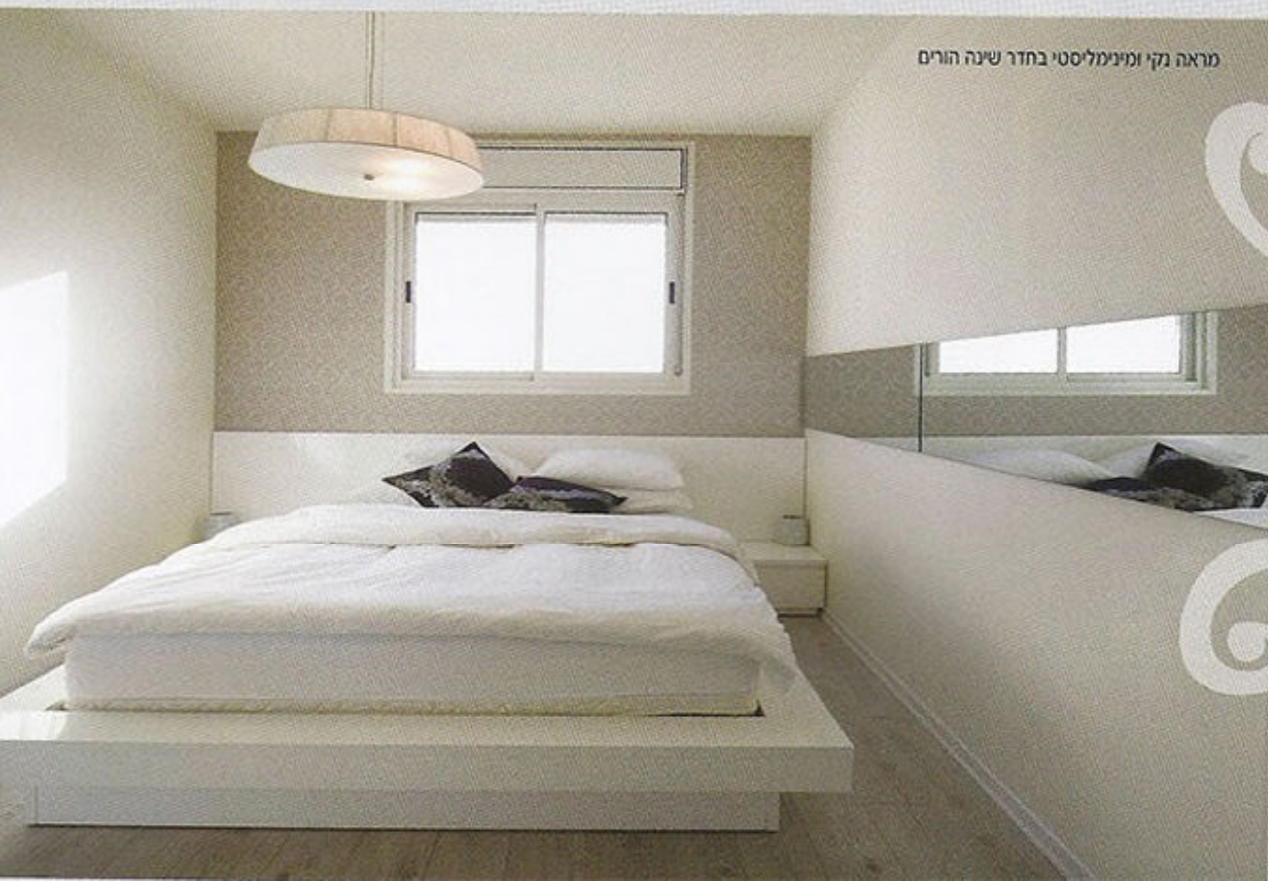
מראה נקי ומינימליסטי בחדר שינה הורים

חדר השינה כולל ריהוט שנבנה במיוחד לגודל וצורת החדר וכולל מיטה נמוכה עם מסגרת עץ צבועה בשלייפ-לק לבן, המונחת על גבי פרקט בהיר. הפרקט והטפט עם הדיגום הרפטיבי העדין שלו, מרכיבים את מראה החדר. משחק הניגודים בחדר השינה בא לידי ביטוי גם במשחקי אור וצל הנוצרים מתליית מראה לאורך הקיר. המראה יוצרת משחקי שקיפיות עם האור החדר מהחלון ומשקפת את החוץ אל תוך הפנים. התוצאה: דירה מהודקת מבחינת השפה העיצובית שלה, המצליחה לשלב בין ניגודים – מתוחכמת ואלגנטית כמו משחק שח-מט, נעימה כמו משחק שש-בש. ■