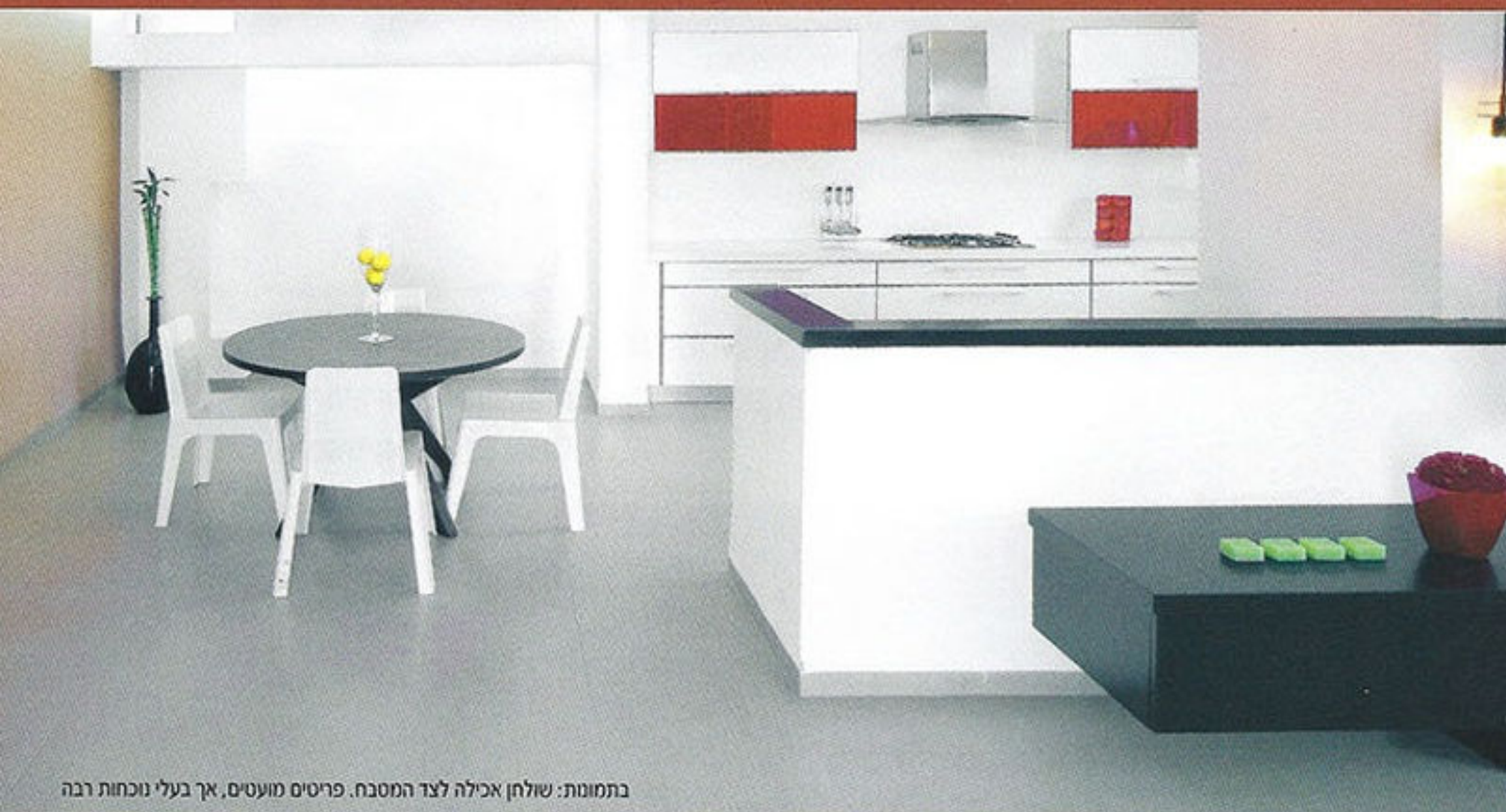
בתמונת: שולחן אכילה לצד המטבח. פריטים מועטים, אך בעלי נוכחות רבה