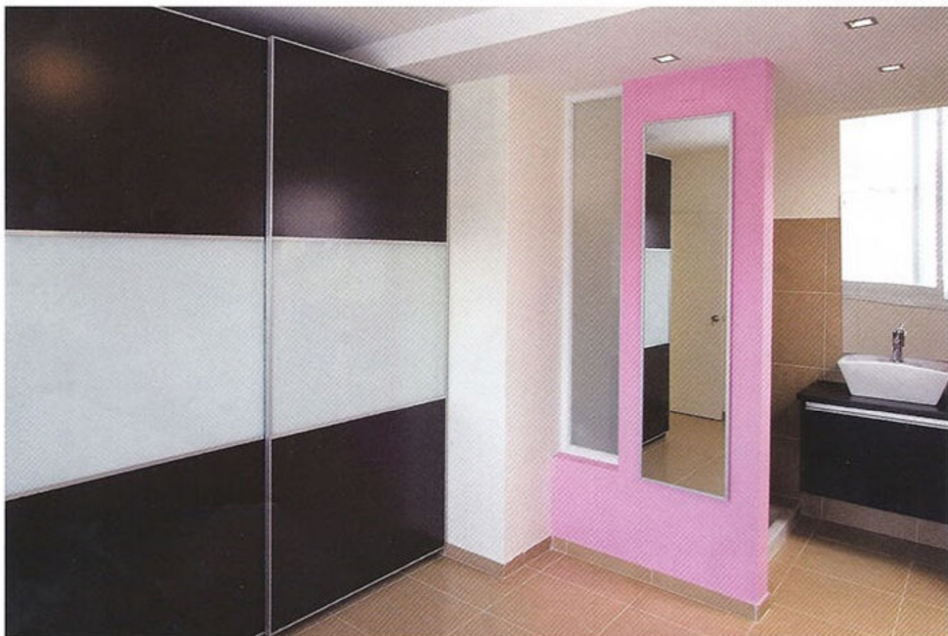
חדר שינה הורים והכניסה לחדר הרחצה הצמוד

הניגוד בין הפנים - המעוצב בצורה מודרנית ויוקרתית - לחוץ, בעל האופי ה"מעברתי", הוא חריף למדי. למרות זאת, כדי לחבר בין החוץ לפנים - על הקירות בפנית האוכל תלויים צילומי תקריב מופשטים שנלקחו מלוחות מודעות ברחוב. מטרת צילומים אלו לחדד ולהדגיש את הקשר הדו-סטרי בין אומנות למציאות בה היא מתקיימת ולאופן בו היא משתקפת בחיים האורבניים. באופן דומה, בחדר המדרגות תלויים צילומי תקריב של אספלט, שצולמו ביום בו נעשו עבודות תשתית של העירייה ברחוב. "בכך ניסיתי ליצור סביבה חזותית טוטאלית של עיצוב ואמנות, המהווה יחדיו מכלול של ביטוי חזותי המתמזג עם החיים", מסכמת המעצבת. ■