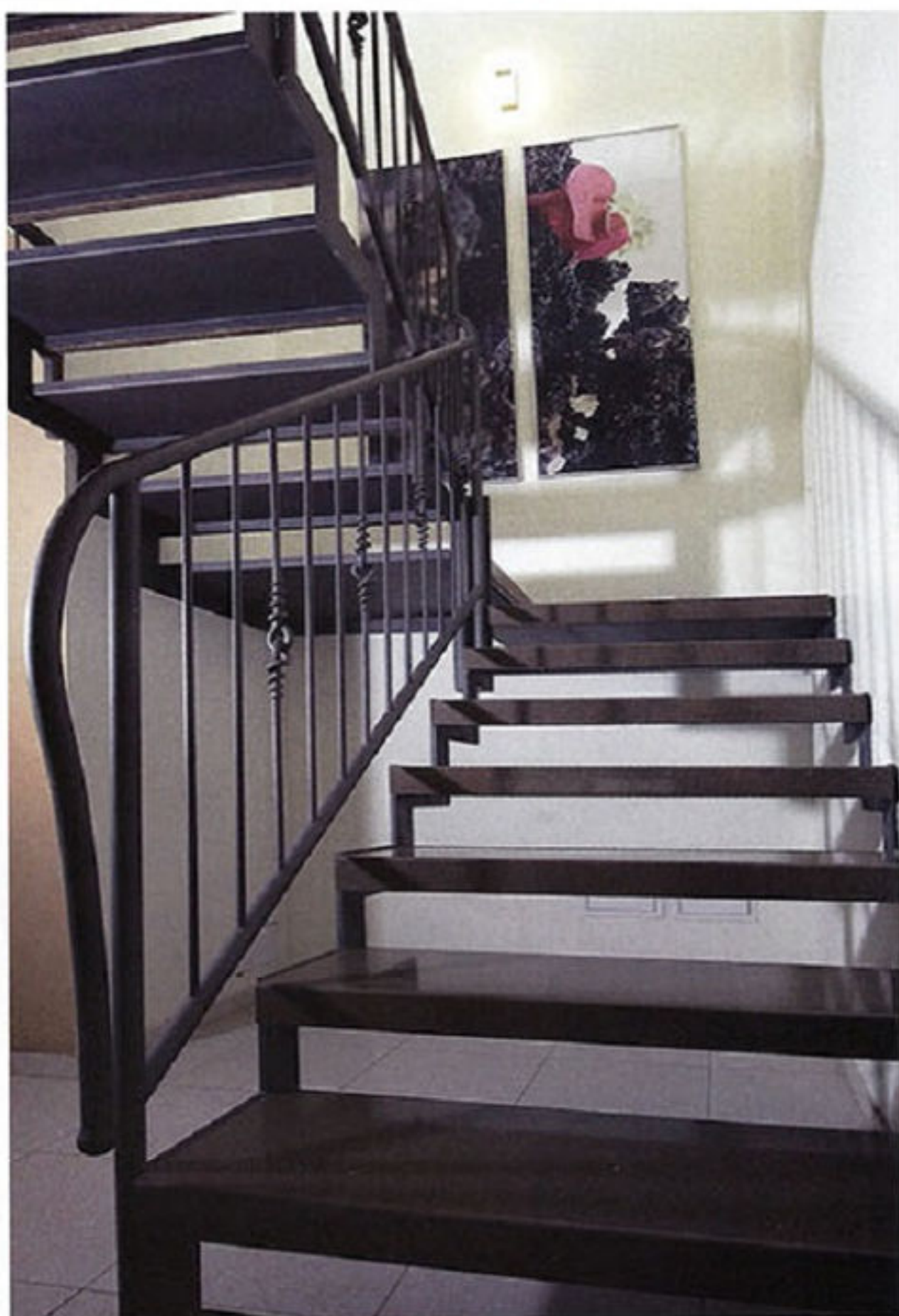
מיסין: גרם הסדרות. מעט חומר והרבה רוח